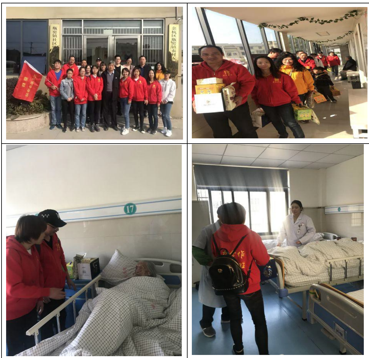
图表 15 慰问养老院