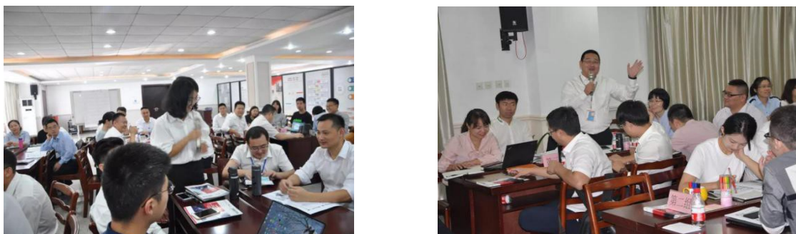
高效能销售实战技巧培训