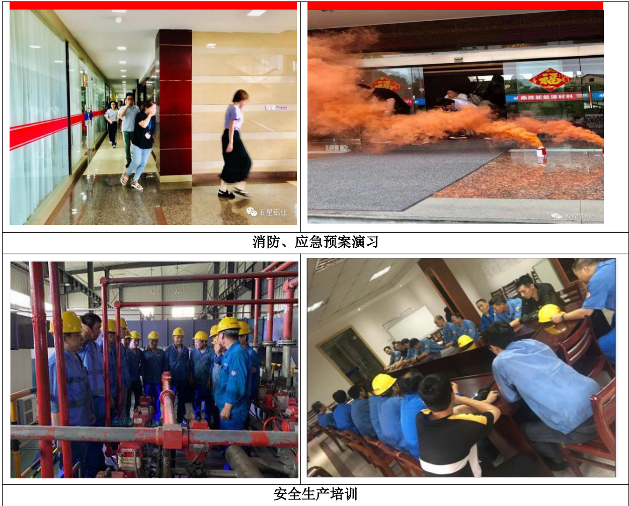
消防、应急预案演习